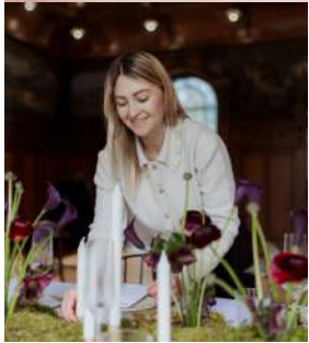
Macoya Weddings macoyaweddings.com